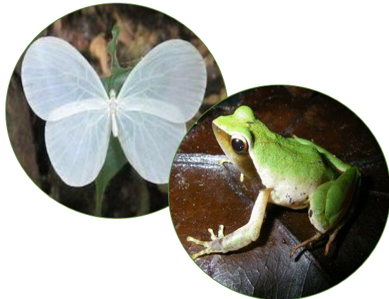
Faune rencontrée dans le Parc national de Gola : crapaud Tai et papillon

Type de subvention : Subvention en vertu d'un contrat