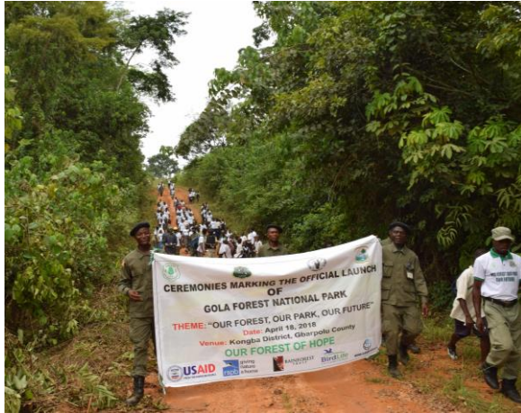
Lancement national du Parc national de Gola au Liberia, avril 2018

Priorité du projet : Gestion communautaire du paysage afin de réduire la déforestation et la perte de biodiversité dans la forêt transfrontalière de Gola