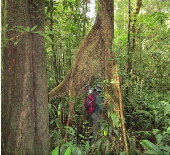
À gauche : Un membre du personnel du projet dans le Paysage de la forêt de Sapo

Pour renforcer la conservation de la forêt et de la biodiversité et appuyer les moyens d'existence communautaires, WABiCC est en faveur d'une gestion novatrice, multipartite, du Paysage forestier transfrontalier de Tai-Grebo-Krahn-Sapo entre le Liberia et la Côte d'Ivoire.