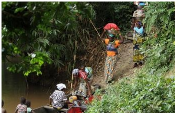
Des femmes et des enfants d'une communauté en lisière de la forêt TGKS reviennent de leurs exploitations.

Priorité du projet : Gestion du Paysage forestier de Tai-Grebo-Krahn-Sapo