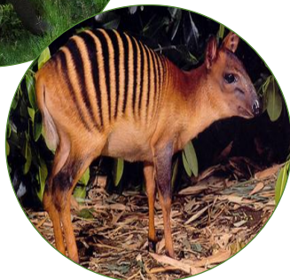
Faune rencontrée dans le TGKS : l'éléphant de forêt d'Afrique et le céphalophe-zèbre